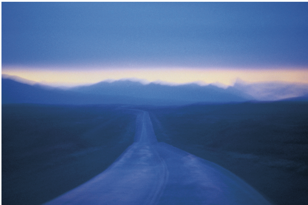
© Véronique Durruty - Paysage émotionnel 7

Exposition tous les jours de 14h00 à 19h Nocturnes mercredi et samedi jusqu'à 22h