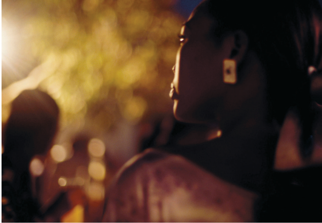
Les nuits de Dakar

Photographie odorante, parfum «Peau ébène» inspiré par la photo, créée par le maître parfumeur Alberto Morillas ( Firmenich )