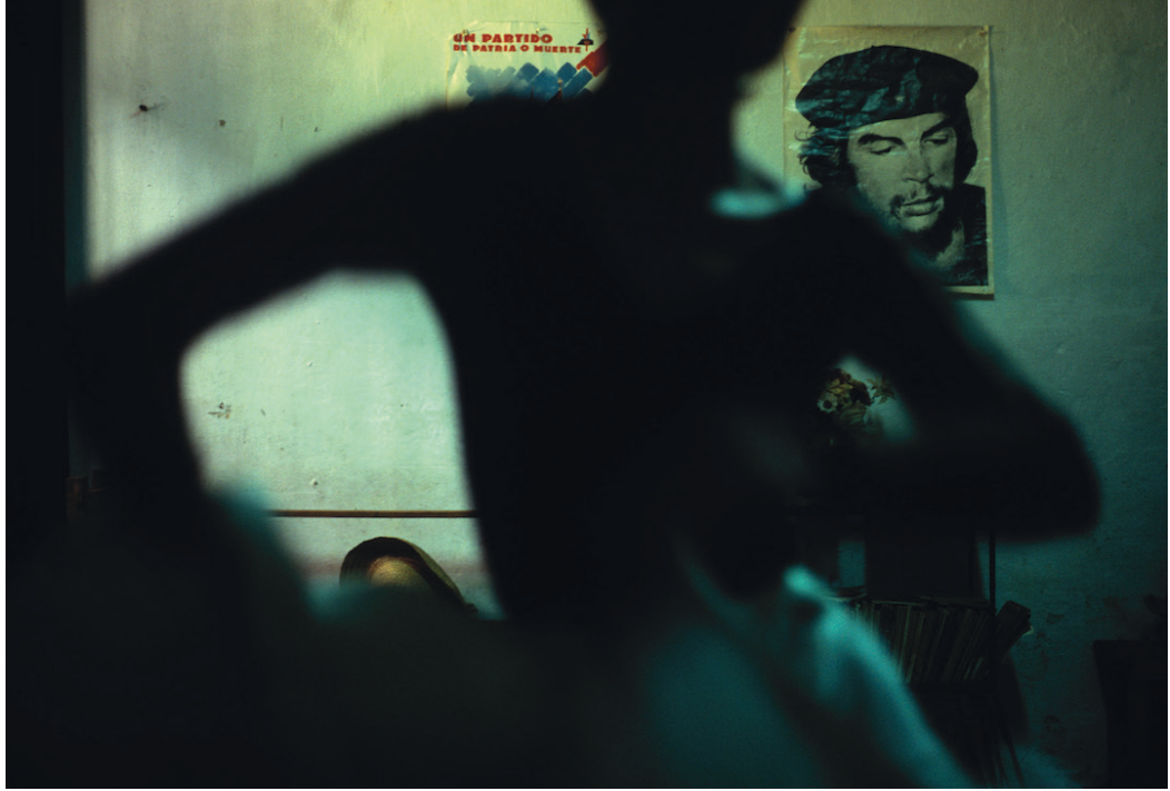
Danse sous l'oeil du Che