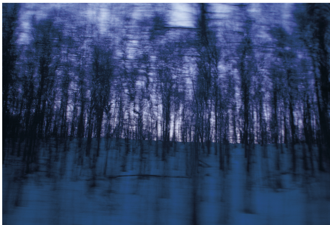
© Véronique Durruty - Paysage émotionnel 2

Vernissage le vendredi 4 octobre à partir de 19h